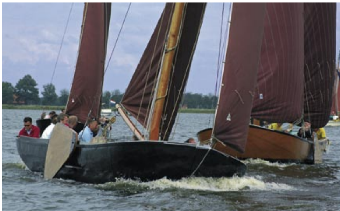
In een praam krijg je het een en ander mee van de natuurelementen