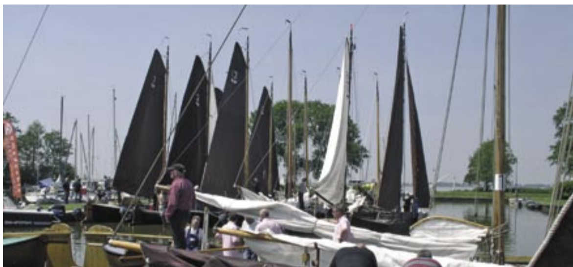
Zeilpramen gereed voor de afvaart bij de 'Klokkendoel'

De datum voor volgend jaar is alweer vastgelegd. Op 8 juni 2007 werpen 28 bedrijven zich weer in de strijd. Bas de Groot: "Er zijn diverse bedrijven die zich nu al voor volgend jaar hebben opgegeven. Anderen wachten nog even af, maar lopen de kans dat ze in 2007 niet kunnen deelnemen. Vol is vol en de belangstelling is groot." •