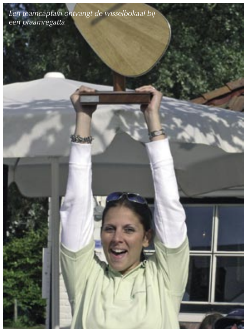
Een teamcaptain ontvangt de wisselbokaal bij een praamregatta

Veel bedrijven combineren een inspirerende middag op het water graag met een informatieve sessie voor de lunch. Dat kan een seminar zijn, een productpresentatie of een brainstormsessie. De Zeilcompagnie regelt naast de zaal ook beamers, screens, geluidsinstallatie en wat verder nog nodig is. De klant heeft geen omkijken naar de facilitaire invulling. •